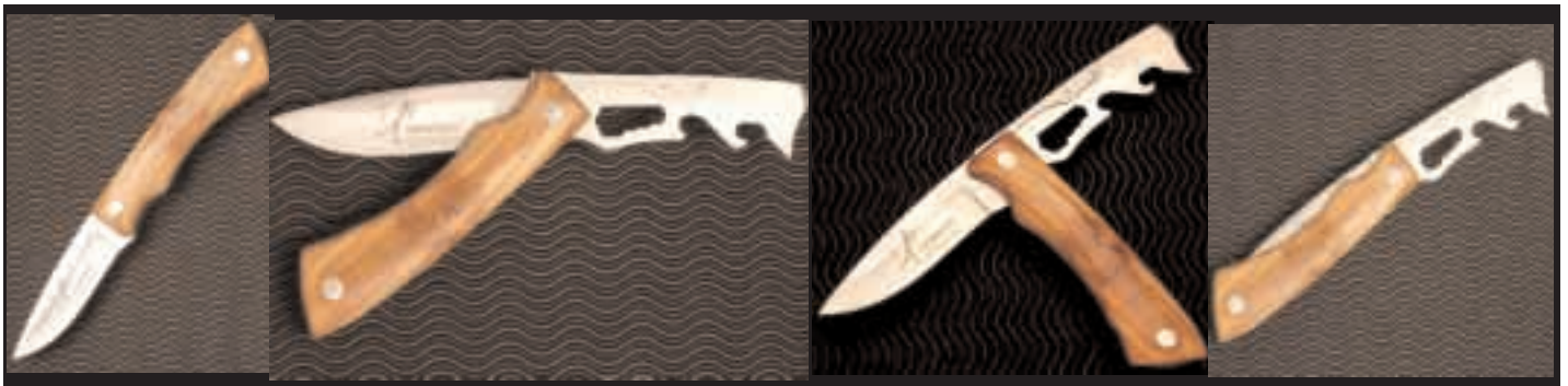
SECUENCIA DE APERTURA DE LA HOJA MULTIFUNCIONAL